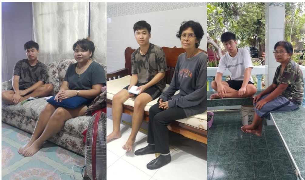
สมาชิกกลุ่มธุรกิจชุมชนแปรรูปพลาสติก ตำบลบางปลา อำเภอบางพลี จังหวัดสมุทรปราการ