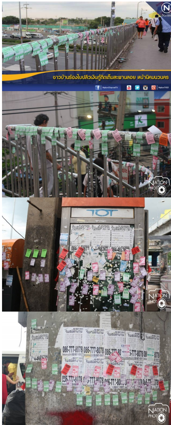
ภาพที่ 1 การติดโพลว