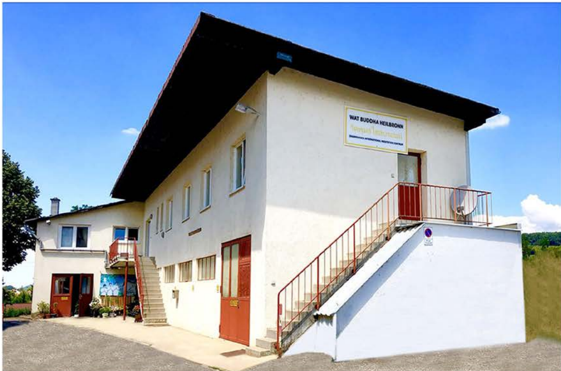
วัดพุทธไฮล์บรอนน์ Wat Buddha Heilbron

Römer straße 586, 47443 Moers, Deutschland