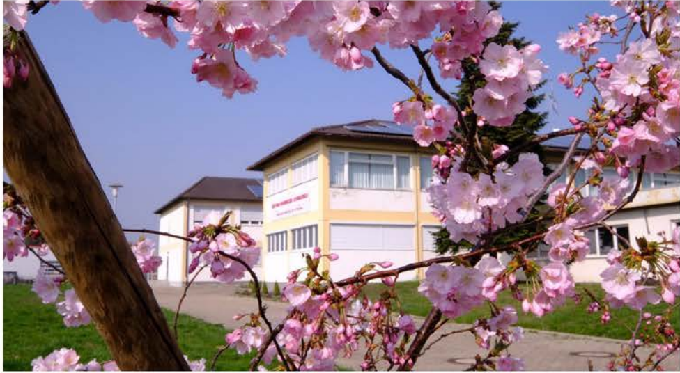
วัดพระธรรมกายชวาร์ชวัลด์ Wat Phra Dhammakaya Schwarzwald Wilhelm-Franz Straße 1, D-77971, Kippenheim, Deutschland