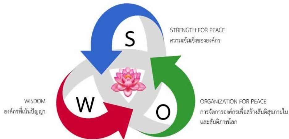
ภาพ ๓.๑ SWO The temple fo Peace Model