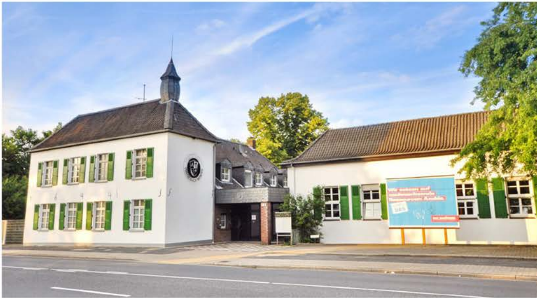
วัดพุทธนอร์ดไรน์-เวสต์ฟาเลน Wat Buddha Nordrhein-Westfalen

Römer straße 586, 47443 Moers, Deutschland