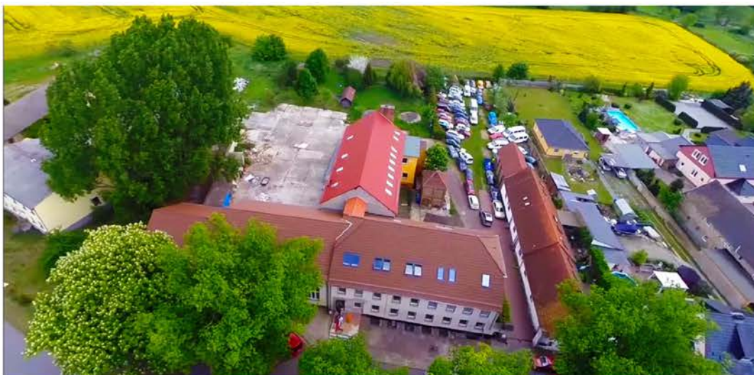
วัดพระธรรมกายเบอร์ลิน Wat Phra Dhammakaya berlin Dahlewitzer Dorfstraße 40A, 15827 Blankenfelde-Mahlow , Deutschland