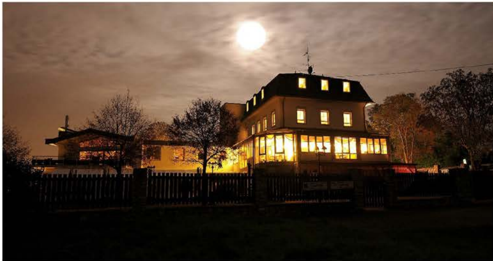
วัดพระธรรมกายไรน์แลนด์ Wat Phra Dhammakaya Rheinland Mainzer Straße 255, 55218 Ingelheim am Rhein, Deutschland