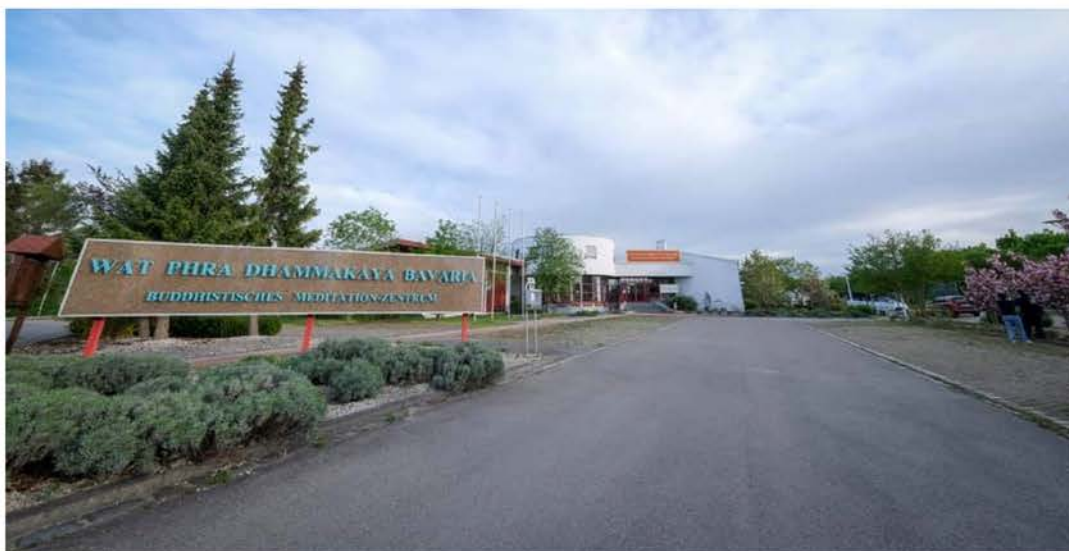
วัดพระธรรมกายบาวาเรีย Wat Phra Dhammakaya bavaria Heinkel Straße1, 86343 KÖnigsbrunn, Deutschland