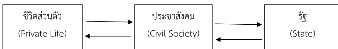
รูปที่ 2-1 ความสัมพันธ์ของปัจเจกบุคคล ประชาสังคม และรัฐ

สังคมและมีการจัดกิจกรรมหรือการเคลื่อนไหวของกลุ่มเพื่อแสดงความต้องการหรือข้อเรียกร้องของกลุ่มให้กับรัฐบาล และเมื่อภาครัฐได้ทราบถึงข้อเรียกร้องของกลุ่มต่างๆในสังคมจะมีการดำเนินนโยบายที่ส่งผลต่อชีวิตและความเป็นอยู่ของประชาชน ดังนั้น หากภาคประชาชนมีการตื่นตัวทางการเมืองสูงจะส่งเสริมให้นโยบายรัฐมีประสิทธิภาพมากขึ้นและจะสะท้อนกลับมาถึงความดีที่ประชาชน ความสัมพันธ์แสดงในรูปที่ 2-1