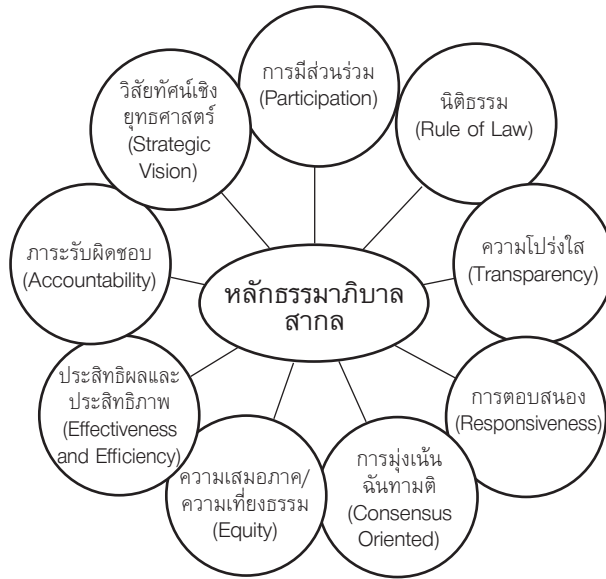
ภาพที่ 3 หลักธรรมาภิบาลสากล (UNDP, 1997)