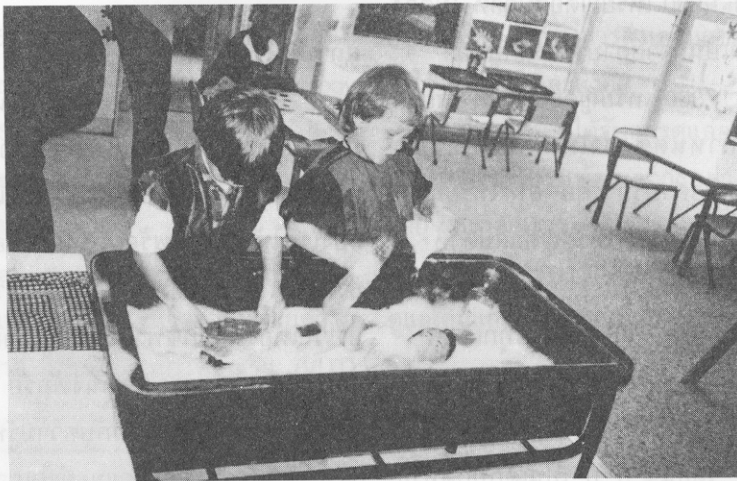
รูปที่ 2 เด็กเล่นอย่างอิสระ