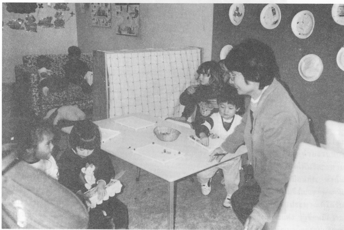
รูปที่ 3 เด็กเล่นตามจินตนาการ

กิจกรรมที่เตรียมไว้ให้เด็กแต่ละวัยจะมีการวางแผน โดยเน้นการกระตุ้นพัฒนาการตามวัย และศักยภาพของเด็กแต่ละคน และปล่อยอิสระให้เด็กเล่นตามจินตนาการ นอกจากนั้นยังส่งเสริมและสนับสนุน