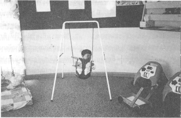
รูปที่ 4 ของเล่นในแต่ละห้อง