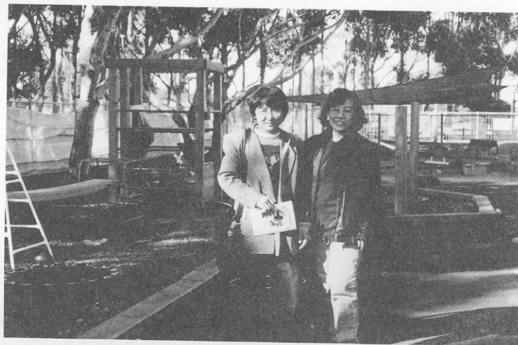
รูปที่ 6 สนามเด็กเล่นนอกรอาคาร

ไปเล่นกลางแจ้งนอกอาคารในช่วงเดือนตุลาคม-เมษายน จะต้องสวมหมวกที่ปิดคอและใบหู พร้อมทาครีม กันแดด SPF 15 นานอย่างน้อย 15 นาที ก่อนออกไป เล่นกลางแจ้ง