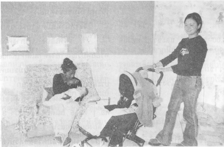
รูปที่ 1 มารดามีส่วนในการให้อาหารเด็ก

พัฒนาการเด็กแต่ละวัย และสภาพของร่างกาย เช่น เด็กอายุ 4-5 ปี มีอ่างน้ำสำหรับเล่นของเล่นในน้ำ และเด็กใส่ผ้าอย่างกันเปื้อน มีการเล่นระบายสี มีตัวต่อพลาสติก และมีไซฟาให้เด็กเล่นปีนป่าย เป็นต้น ส่วนห้องเด็กอายุต่ำกว่า 1 ปี ก่อนนอนเจ้าหน้าที่จะเปิดเพลงเบา ๆ กล่อมเด็กทุกครั้ง แต่ละห้องบิดามารดาสามารถเข้าเยี่ยมเด็กและมีส่วนร่วมในการให้นมหรือให้อาหารเด็ก นอกจากนั้นภายนอกอาคารเป็นสนามหญ้ากว้าง แบ่งเป็น 2 ส่วน มีเครื่องเล่นสำหรับเด็กได้เล่นในช่วงเช้า (11.00 น.) และช่วงบ่าย (16.30 น.)