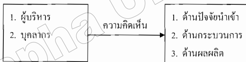
ภาพที่ 1 กรอบแนวคิดในการวิจัย

การศึกษาค้นคว้าครั้งนี้ผู้วิจัยมุ่งศึกษาการพัฒนาคุณภาพการศึกษาของคณะศึกษาศาสตร์ มหาวิทยาลัยแห่งชาติลาว ผู้วิจัยใช้กรอบแนวคิดตามมาตรฐานการศึกษาตามองค์ประกอบ 9 ด้านของมหาวิทยาลัยไทย (สำนักงานคณะกรรมการการศึกษาแห่งชาติ, 2543, หน้า 18) ได้แก่ 1) ปรัชญา ปณิธาน วัตถุประสงค์ และแผนการดำเนินงาน 2) การเรียนการสอน 3) กิจกรรมการพัฒนานิสิตนักศึกษา 4) การวิจัย 5) การบริการแก่สังคม 6) การทำนุบำรุงศิลปและวัฒนธรรม 7) การบริหารจัดการ 8) การเงินและงบประมาณ 9) ระบบและกลไกการประกันคุณภาพ แนวคิดเรื่อง วงจรคุณภาพ PDCA (Deming) ประกอบด้วย การวางแผน (Plan) การจัดกระทำ (Do) การตรวจสอบ (Check) การปรับปรุง (Act) การพัฒนาคุณภาพของ แซลลิส (Sallis, 1996, p. 20) อ้างถึงใน เหนียว สีลาวงศ์, 2551) คือ 1) การควบคุมคุณภาพ 2) การประกันคุณภาพ