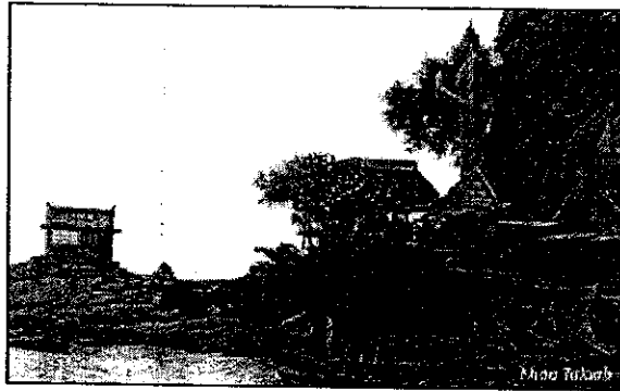
ภาพที่ 4 Khao Takaib