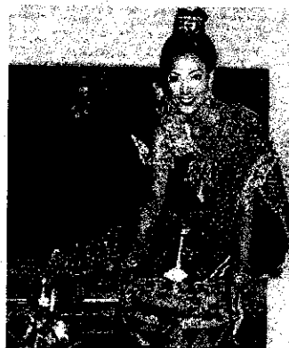
ภาพที่ 3 Loy Krathong Festival