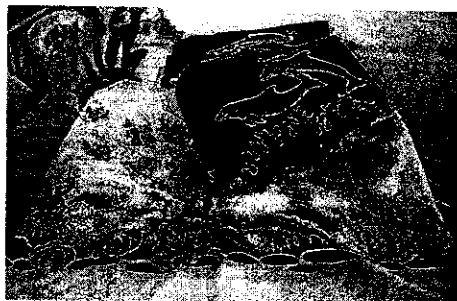
ภาพที่ 1 Local product

Look at the pictures below. Choose two pictures and describe each picture with four sentences. Give a greeting and introduce yourself before describing the first picture.