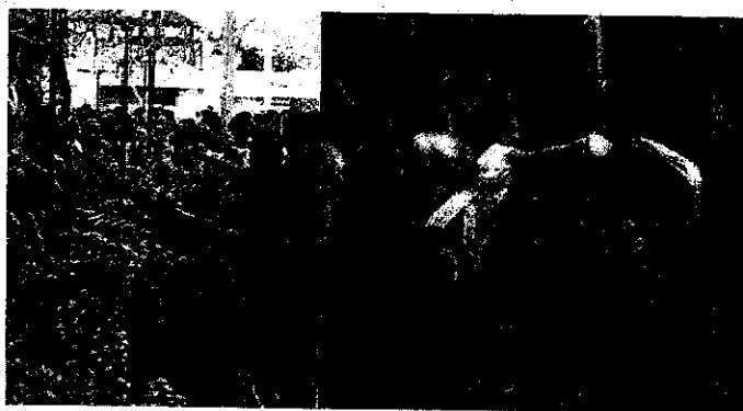
ภาพที่ 2 Songkran Festival