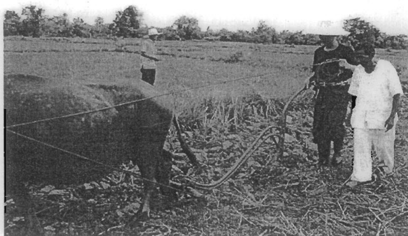
ภาพที่ 2-4 การเสกนาในภาคเหนือ (การเสกนาในภาคเหนือ, 2554)