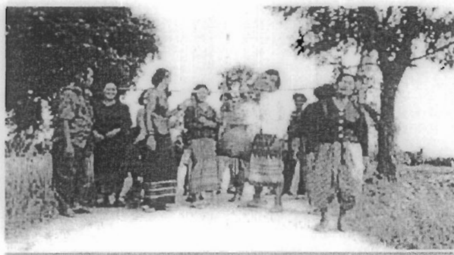
ภาพที่ 2-2 แหนางแมวภาคอีสาน (โรงเรียนกาญจนาภิเษกวิทยาลัย สุพรรณบุรี, 2554)