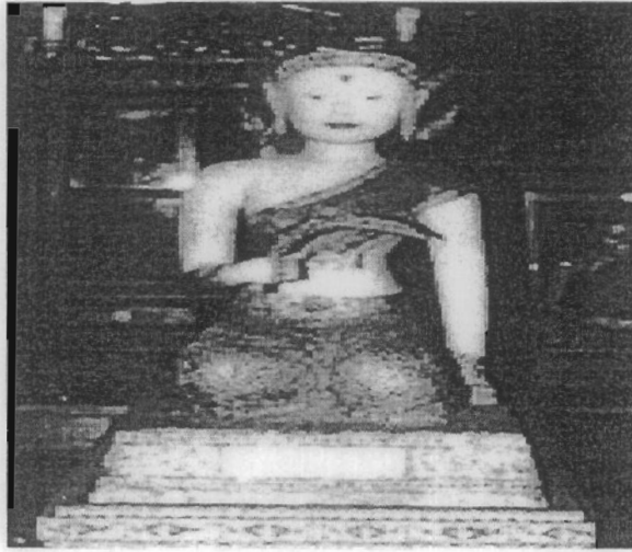
ภาพที่ 2-1 แม่โพสพ (โรงเรียนกาญจนาภิเษกวิทยาลัย สุพรรณบุรี, 2554)

เฉียงจากขวาไปซ้าย นุ่งผ้าจีบชายกรอม ลงมาถึงปลายหน้าแข้งทรงเครื่องถนิมพิมพาภรณ์ตระการ ตา ไร้ผมยาวสลวยปะบ่ามีกระจงกรอบหน้าคล้ายมงกุฎและจอนหูกอนชคช้อย มือข้างหนึ่งชูรวง ข้าวประทับนั่งพับเพียบเรียบร้อยแบบแพนงเชิงอย่างไทยโบราณ