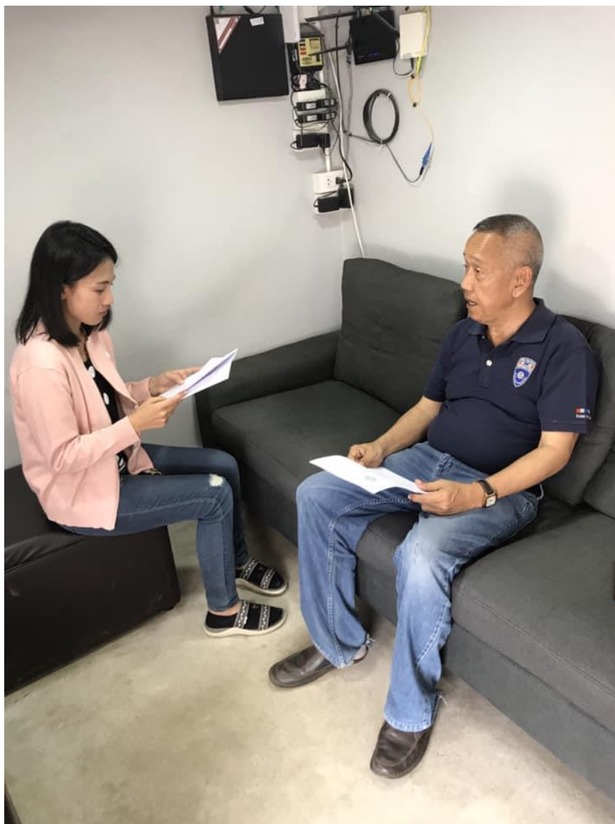
สัมภาษณ์ตำรวจตรวจคนเข้าเมือง จังหวัดสระแก้ว