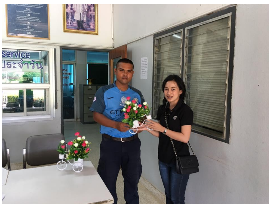
สัมภาษณ์บุคลากร การไฟฟ้าส่วนภูมิภาค อำเภอ โคกสูง