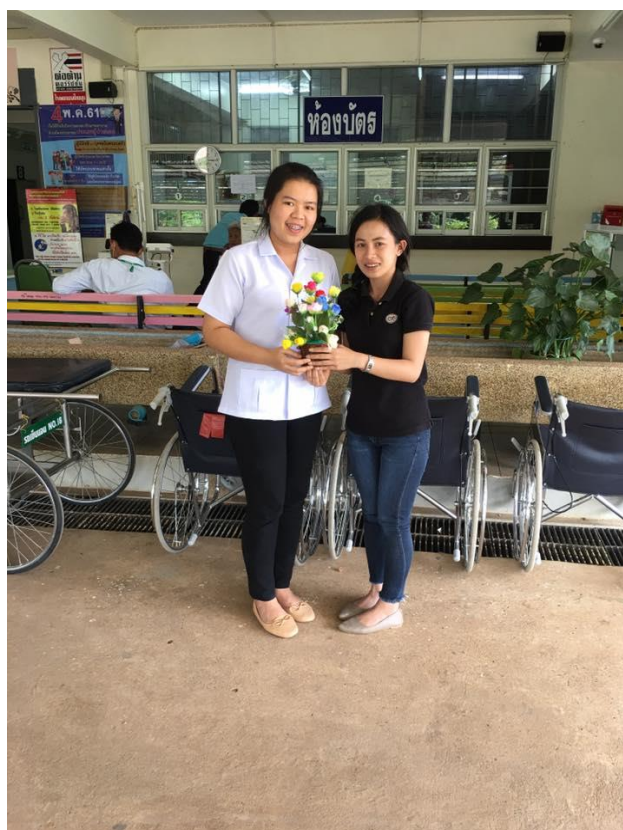
สัมภาษณ์เจ้าหน้าที่ตำรวจ สถานีตำรวจภูธร อำเภอกอกสูง