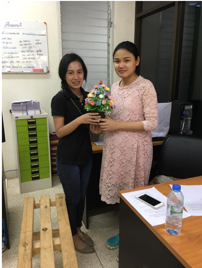
สัมภาษณ์ บุคลากร โรงพยาบาล โศกสูง