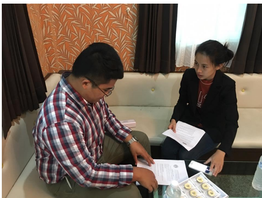
สัมภาษณ์ผู้ประกอบการที่มีแรงงานต่างด้าว อำเภอ โคกสูง