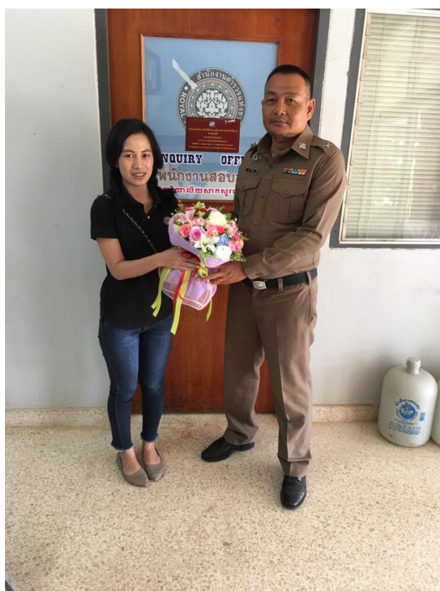
สัมภาษณ์เจ้าหน้าที่ตำรวจ สถานีตำรวจภูธร อำเภอกอสุ่ง