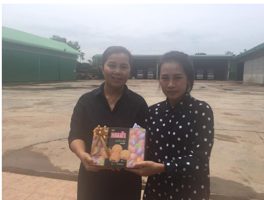
สัมภาษณ์ตำรวจตรวจคนเข้าเมือง จังหวัดสระแก้ว