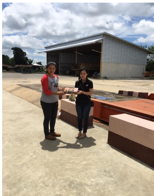
สัมภาษณ์ผู้ประกอบการที่มีแรงงานต่างด้าว อำเภอ โคกสูง