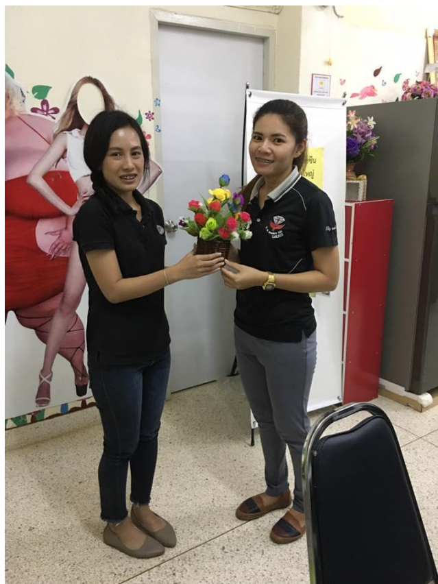
สัมภาษณ์ บุคลากร โรงพยาบาล โศกสูง