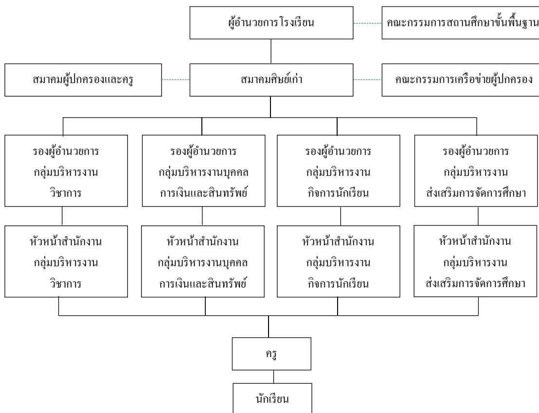
ภาพที่ 2 โครงสร้างการบริหารงานของโรงเรียนพานทองสภานูปถัมภ์ (โรงเรียนพานทองสภานูปถัมภ์, 2558)

โดยมีโครงสร้างการบริหารงานของโรงเรียนพานทองสภานูปถัมภ์ สามารถสรุปได้ ดังภาพที่ 2