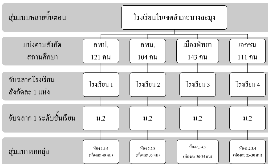
ภาพที่ 3-1 การสุ่มตัวอย่าง

4) สุ่มตัวอย่างแบบยอกกลุ่ม (Cluster sampling) โดยสุ่มแบบยอกห้อง โดยการสุ่มตัวอย่างแบบง่าย (Simple random sampling) แบบไม่ใส่คืน ตามสัดส่วนประชากร เพื่อให้ได้กลุ่มตัวอย่างครบถ้วนสมบูรณ์เป็นตัวแทนประชากร