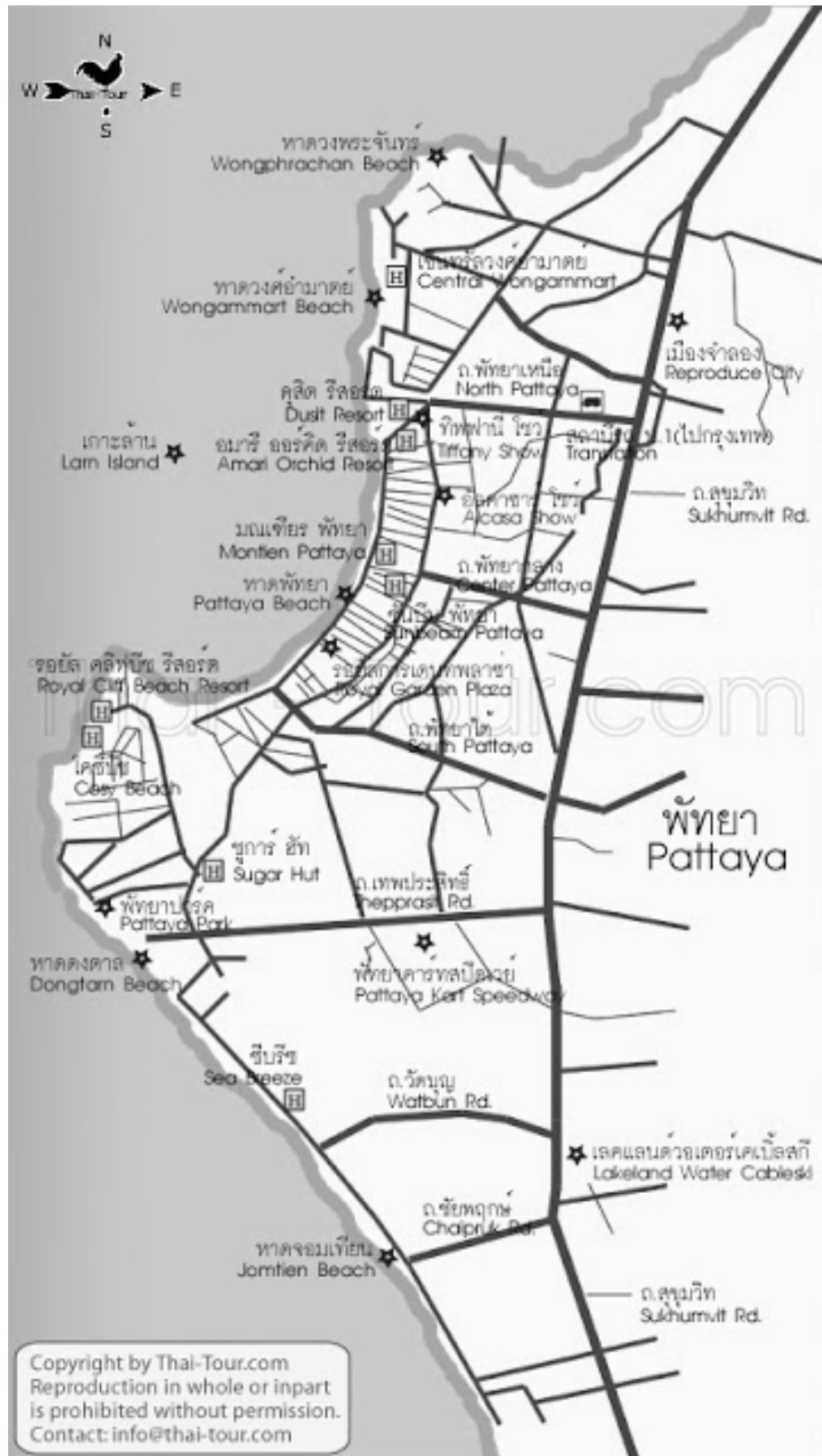
ภาพที่ 2-1 แผนที่ชายหาด เมืองพัทยา