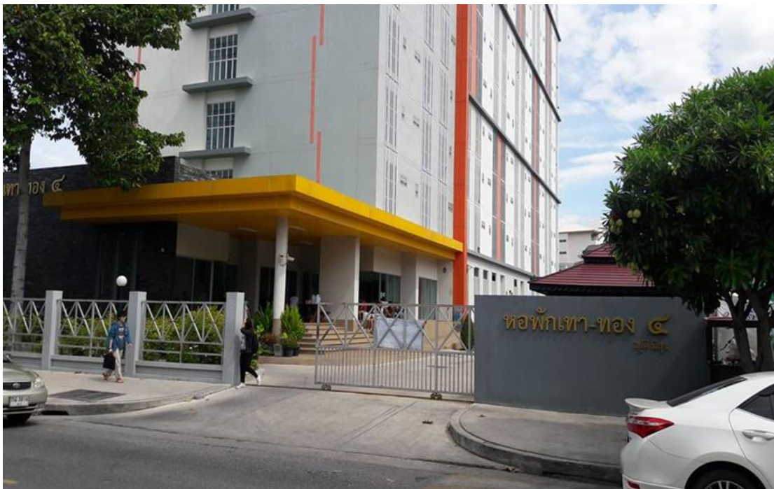
ภาพที่ 7 หอพักเทา-ทอง 4