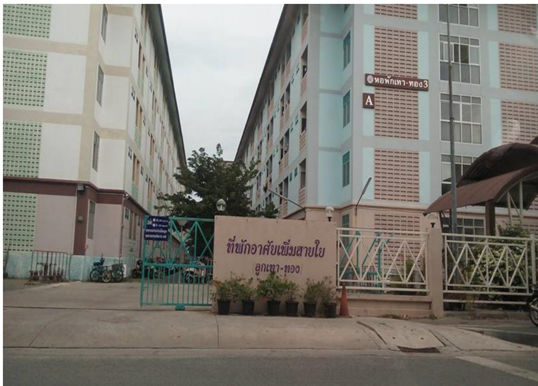
ภาพที่ 6 หอพักเทา-ทอง 3