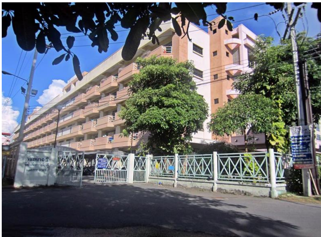
ภาพที่ 3 หอพัก 15