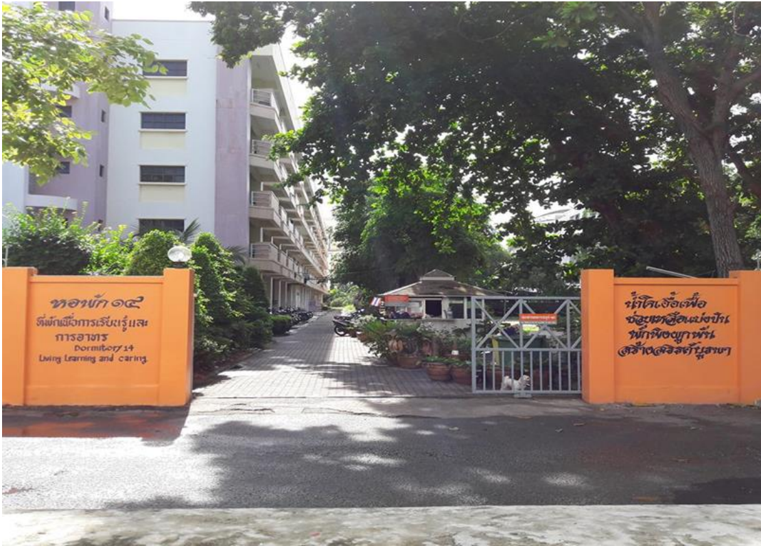
ภาพที่ 2 หอพัก 14