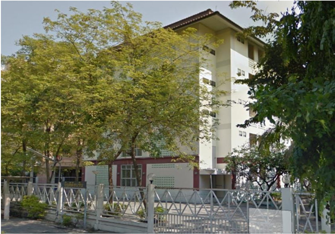
ภาพที่ 5 หอพักเทา-ทอง 2