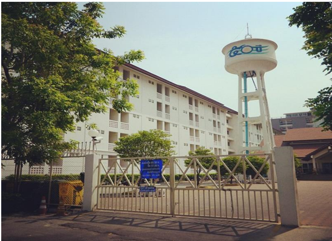
ภาพที่ 4 หอพัก 50 ปี เทา-ทอง