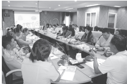
ภาพที่ 2 การส่งมอบแผนอุตสาหกรรมเชิงนิเวศให้แก่เทศบาลตำบลทับมา