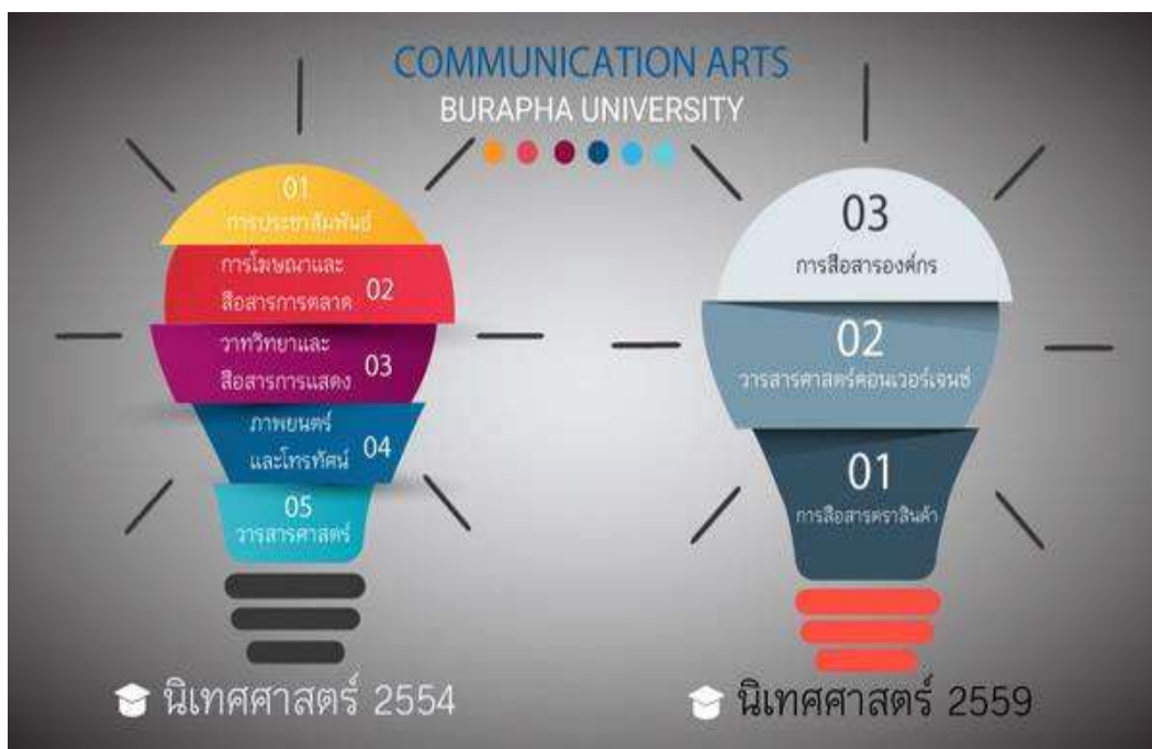
ภาพที่ 1 หลักสูตรนิเทศศาสตรบัณฑิต หลักสูตรปรับปรุง พ.ศ. 2554 กับ พ.ศ. 2559

ปัจจุบันหลักสูตรนิเทศศาสตรบัณฑิต ปรับปรุงครั้งที่ 5 พ.ศ. 2559 มีเหตุผลหลักในการปรับปรุงก็เพื่อให้สอดคล้องกับบริบทของสังคมและเทคโนโลยีที่เปลี่ยนไปตามความต้องการของตลาด และเพื่อให้เป็นไปตามมาตรฐานทางการศึกษาที่คณะกรรมการการอุดมศึกษา ได้จัดทำกรอบมาตรฐานคุณวุฒิระดับอุดมศึกษาขึ้นมากำหนดให้ทุกหลักสูตรปฏิบัติตาม โดยให้มีการปรับปรุงหลักสูตรทุก ๆ 4-5 ปี เนื่องจากการเข้ามาของเทคโนโลยีสื่อดิจิทัลที่กระทบคนในสังคมในภาคส่วนต่าง ๆ ไม่ว่าจะเป็นอุตสาหกรรมสื่อ และองค์การธุรกิจ รวมถึงความต้องการของผู้เรียนที่เปลี่ยนแปลงไป โดยภาควิชานิเทศศาสตร์มีปรับเปลี่ยนชื่อวิชาแขนงวิชา เพื่อให้ทันสมัย และลดจำนวนสาขาวิชาให้เหลือ 3 แขนงวิชา คือ 1. การสื่อสารการตลาด เนื่องจากเทคโนโลยีด้าน E-Commerce หรือพาณิชย์อิเล็กทรอนิกส์ มีผลให้การใช้ชีวิตในปัจจุบันเปลี่ยนไปอย่างมาก การซื้อขายสินค้าหรือการบริการโดยการส่งข้อมูลทางอิเล็กทรอนิกส์ผ่านทางเครือข่าย ทั้งการชำระสินค้าและบริการต่าง ๆ 2. การสื่อสารองค์กร เนื่องจากสภาพแวดล้อมขององค์กร การสร้างภาพลักษณ์ที่เกี่ยวข้องกับองค์กร การใช้กลยุทธ์การสื่อสารทั้งภายในและภายนอกองค์กร และการบริหารและการจัดการการสื่อสารขององค์กรที่เปลี่ยนไป จากที่เคยใช้ชื่อการประชาสัมพันธ์ และ 3. วารสารศาสตร์คอมพิวเตอร์ เนื่องจากเทคโนโลยีการสื่อสารที่เปลี่ยนไป การปิดตัวของสื่อสิ่งพิมพ์ หนังสือ และวารสารต่าง ๆ ทำให้เกิดเป็นธรรมชาติของสื่อในยุคหลอมรวม องค์กรสื่อมีการเปลี่ยนแปลงรูปแบบทางธุรกิจของสื่อ เกิดทักษะพื้นฐานสำหรับการทำงานของสื่อมวลชนในยุคหลอมรวม ศิลปะในการสร้างเนื้อหา