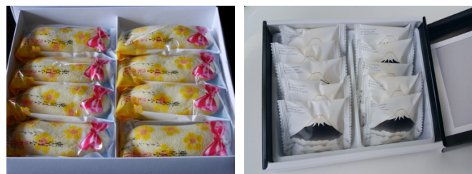
ภาพที่ 15 (ซ้าย-ขวา)ความมีระเบียบ สะอาดตา เรียบง่ายและสวยงามภายในบรรจุภัณฑ์

ลักษณะนิสัยโดยรวมที่เห็นจากภายนอกของคนญี่ปุ่น ที่ดูมีระเบียบวินัย ซื่อซื่อของก็ต้องต่อคิวต่อแถว บ้านเรือนถนนหนทางก็สะอาดอยู่เสมอ อีกทั้งยังมีวิถีชีวิตที่เรียบง่าย ล้วนแล้วแต่มีส่วนในการถ่ายทอดบุคลิกที่ชัดเจนเหล่านี้ของคนญี่ปุ่น แสดงตนอยู่ในงานออกแบบบรรจุภัณฑ์ด้วยเช่นกัน ตัวอย่างบรรจุภัณฑ์สินค้าที่เราพบเห็นมักจะออกแบบด้วยรูปทรงเรียบง่าย แต่แฝงไปด้วยความเป็นระเบียบ สีสันสะอาดตา พร้อมการออกแบบที่มีลูกเล่นสวยงามในบรรจุภัณฑ์เฉพาะหน่วยชิ้นเล็กที่อยู่ภายใน ตัวอย่างเช่น กล่องขนมของฝากที่เรามักพบเห็นเสมอ ๆ ว่านอกจากกล่องภายนอกจะห่อหุ้มป้องกันความเสียหายแล้วภายในกล่องก็มีการแบ่งช่องแยกชิ้นขนมอย่างเป็นระเบียบ และให้ความสะดวกในการรับประทาน หรือแม้แต่ซองของฝากชิ้นเล็ก ๆ ขนมที่ขายริมทางเดินก็ยังมีถุงซองสะอาดตาห่อหุ้มอย่างเรียบร้อย น่าจับต้อง ซื่อหาทำให้ผู้รับรู้สีกดีเมื่อได้รับด้วยการเอาใจใส่ของทั้งผู้ขายและผู้ซื้อมาฝาก