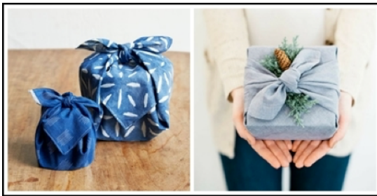
ภาพที่ 1 การห่อผ้าแบบฟูโรชิกิ (Furoshiki) ของคนญี่ปุ่น

เอง มีความนิยมห่อสิ่งของด้วยผ้าตามวิธีโบราณตั้งแต่สมัยศตวรรษที่14 เรียกว่า “ฟูโรชิกิ” ซึ่งเดิมเป็นการห่อผ้าสำหรับไปอาบน้ำในห้องน้ำรวมของคนญี่ปุ่น และใช้เป็นผ้าปูเพื่อวางของบนพื้นในห้องน้ำ โดยคำว่า “ฟูโร” หมายถึง ห้องน้ำ และ “ชิกิ” หมายถึง วางแผ่ออกจากกัน (ศิลปะการห่อผ้าแบบญี่ปุ่น, 2561: ออนไลน์) ต่อมาจึงได้นำผ้าฟูโรชิกิ ซึ่งมีทั้งผ้าไหม ผ้าฝ้าย ผ้าป่านมาใช้ในการห่อสิ่งของต่าง ๆ ในชีวิตประจำวันของคนญี่ปุ่น เช่น ห่อข้าวกล่อง ห่อหนังสือ ห่อของขวัญและสิ่งของให้กันในเทศกาลต่าง ๆ