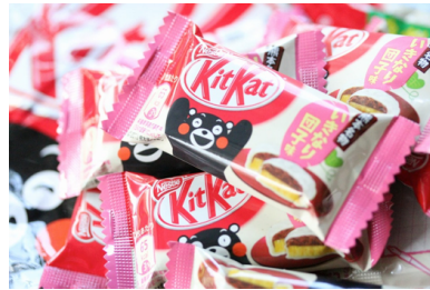
ภาพที่ 7 บรรจุภัณฑ์ KitKat Ikinari Dango กับลวดลายคิเมะมง

ตัวที่ชัดเจน เป็นสื่อประชาสัมพันธ์อยู่ในทุกส่วนของสินค้าและกิจกรรมของเมือง ทำให้ในระหว่างปี 2011 ถึงปี 2013 ตัวการ์ตูนคิเมะมงตัวนี้สามารถสร้างผลทางเศรษฐกิจได้ถึง 1.2 ล้านเยน (เกตุวดี Marumura, 2557:16) และในปลายปี 2011 ได้รับการโหวตจากชาวญี่ปุ่นทั่วประเทศจนได้รับรางวัลชนะเลิศการประกวดตุ๊กตาสัญลักษณ์จากจำนวน 350 ตัว ที่แต่ละท้องถิ่นส่งเข้าประกวด โดยมีการสร้างเป็นผลิตภัณฑ์ต่างๆ มากถึง 23000 ชิ้น (วิกิพีเดีย, 2018 : ออนไลน์) และนอกจากนี้ยังใช้เป็นสัญลักษณ์ในกิจกรรมฟื้นฟูเมืองคิเมะโมโตะ หลังภัยพิบัติแผ่นดินไหวเมื่อปี พ.ศ.2559 อีกด้วย เช่น คิทแคทได้มีคอลเลคชั่นใหม่วางจำหน่ายเพื่อช่วยระดมทุนบริจาคในโครงการฟื้นฟูจังหวัดคิเมะโมโตะ ในชื่อ “KitKat Ikinari Dango” รสชาติขนมดังโงะมันม่วงไส้ถั่วแดง ขนมขึ้นชื่อของจังหวัดคิเมะโมโตะ ในบรรจุภัณฑ์ที่สดใสสดใสลวดลายคิเมะมงตัวแทนจังหวัดคิเมะโมโตะ