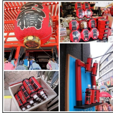
ภาพที่ 14 โคมไฟลี้ญ์ลักษณะวัดอาซากุสะ ถูกใช้ในการถ่ายทอดรูปทรงและลดทอนลงบนบรรจุภัณฑ์