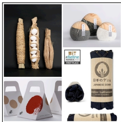
ภาพที่ 9 บรรจุภัณฑ์ญี่ปุ่นที่ออกแบบโดยใช้วัสดุธรรมชาติ สี รูปทรงที่กลมกลืนกับธรรมชาติ

ประเทศญี่ปุ่นมีภูมิประเทศเป็นหมู่เกาะ ล้อมรอบด้วยทะเล ร้อยละ 70 ของพื้นที่เป็นภูเขา มีความเสี่ยงต่อการเกิดภัยพิบัติทางธรรมชาติเช่นแผ่นดินไหวและสึนามิอยู่ตลอดเวลา คนญี่ปุ่นจึงเรียนรู้ที่จะอยู่กับธรรมชาติอย่างยำเกรง เคารพและอ่อนน้อม มุ่งที่จะอยู่อย่างกลมกลืนกับธรรมชาติ มากกว่าการทำลาย เราจะสังเกตเห็นได้จากการออกแบบบรรจุภัณฑ์ของญี่ปุ่นนั้นมักจะออกแบบอย่างเรียบง่าย ใช้วัสดุ รูปทรง และสีโทนอ่อนกลมกลืนไปกับธรรมชาติ เช่น สีกลุ่ม Earth tone ทำให้งานมีความคลาสสิก เรียบง่ายและกลมกลืนกับธรรมชาติ