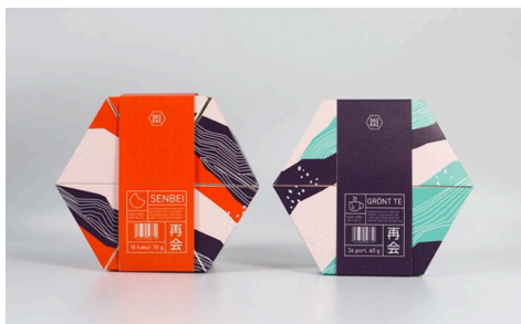
ภาพที่ 5 บรรจุภัณฑ์ที่มีแนวทางการห่อ การพับตามแบบอย่างโอริกามิ

นอกจากนั้นแล้วความแข็งแรงทางโครงสร้างในการพับแบบโอริกามิก็น่าจะตอบโจทย์ผู้ใช้สอยสำหรับบรรจุภัณฑ์ที่คุ้มครองป้องกันผลิตภัณฑ์และอำนวยความสะดวกในการใช้งานได้ดี ในโครงการวิจัยของนักศึกษาที่ทำร่วมกับโครเนส (Krones) ในการสร้างขวดภาชนะบรรจุอัจฉริยะที่สามารถบีบได้แบบหมดจด โดยมีแนวคิดมาจากการพับแบบโอริกามิ ที่ทำให้ขวดสามารถใช้บรรจุของเหลวชั้นหนืดได้ดี และสามารถบีบแบนให้ของเหลวภายในไหลออกจนหมดสุดทำได้อย่างสมบูรณ์แบบ (ศิรินทรา บุญสำเร็จ, 2017 : 72-73) เป็นการต่อยอดในการสร้างนวัตกรรมงานออกแบบบรรจุภัณฑ์ที่มีพื้นฐานจากวัฒนธรรมเก่าแก่ของญี่ปุ่น