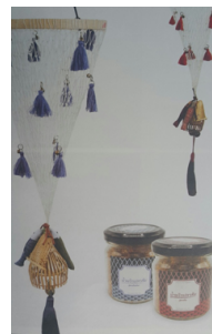
ภาพที่ 17 บรรจุภัณฑ์น้ำพริกปลาส้ม กวีานพะเยา จ. พะเยา