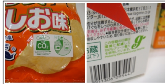
ภาพที่ 10 การแสดงสัญลักษณ์ของบรรจุภัณฑ์เพื่อสิ่งแวดล้อม

ประเทศญี่ปุ่นเป็นผู้นำในการออกแบบบรรจุภัณฑ์ที่ใช้งานง่ายไม่ยุ่งยาก มีความเท่าเทียมในการใช้งานกับทุกคนที่เรียกว่า Universal Design Packaging ที่ช่วยส่งเสริมเกื้อหนุนให้เกิดบรรจุภัณฑ์รักษ์โลกไปพร้อม ๆ กัน ในหลากหลายวิธีการ ตัวอย่างเช่น กล่องขนมกุลิโกะ ป๊อกกี้ที่ออกแบบกล่องให้มีรอยปรุทั้งสองด้าน สามารถเปิดกล่องได้ง่ายและแกะพับให้แบนเพื่อทิ้งได้ง่ายขึ้น เอื้อต่อการรีไซเคิลและทิ้งขยะ ตามหลักการพื้นฐานของ Universal Design Packaging ในเรื่อง easy to dispose หรือการง่ายต่อการกำจัดทิ้งหลังการใช้งาน ช่วยลดต้นทุนและระยะเวลาในการกำจัดขยะ