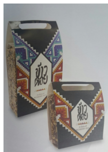
ภาพที่ 18 บรรจุภัณฑ์ข้าวหอมข้าวไรเบอรรี่ บ้านหนองหล่ม จ.พะเยา

จากตัวอย่างงานออกแบบบรรจุภัณฑ์ของประเทศญี่ปุ่นสู่การออกแบบบรรจุภัณฑ์สินค้าไทยที่มีความพยายามในการนำอัตลักษณ์ไทยในด้านต่าง ๆ มาใช้ในการสร้างจุดจดจำและเพิ่มความน่าสนใจให้กับสินค้าไทยแล้วนั้น ส่วนใหญ่บรรจุภัณฑ์สินค้าไทยในปัจจุบันทำได้ดีขึ้นมาก มีจุดจดจำในสินค้าที่ไม่เหมือนชาติไหน ให้ความสำคัญกับความเป็นชุมชนและอัตลักษณ์ท้องถิ่น ถ่ายทอดลงสู่งานออกแบบสินค้าและบรรจุภัณฑ์ สังเกตได้จากตั้งแต่อดีตในโครงการ OTOP จนสู่อีกหลากหลายโครงการในปัจจุบัน เช่น เสน่ห์เที่ยว เสน่ห์ไทย กับการพัฒนาสินค้าต้นแบบของที่ระลึกเพื่อการท่องเที่ยว โดยกรมการท่องเที่ยว กระทรวงการท่องเที่ยวและกีฬา หรือ โครงการชุมชนท่องเที่ยว OTOP นวัตวิถี โดยกรมการพัฒนาชุมชน กระทรวงมหาดไทย ก็ล้วนแต่ให้ความสำคัญกับความเป็นอัตลักษณ์ของชุมชนและท้องถิ่น แต่ส่วนใหญ่เป็นลักษณะทางภายนอกหรือลักษณะทางกายภาพ เมื่อเปรียบเทียบกับบรรจุภัณฑ์ญี่ปุ่นแล้ว บรรจุภัณฑ์ไทยยังขาดแนวคิดที่มาจากอัตลักษณ์บุคคล เช่น ลักษณะทางบุคคลและอุปนิสัยต่าง ๆ ของคนไทยซึ่งอาจเรียกได้ว่าเป็นลักษณะทางจิตภาพ เช่น ความสนุกสนาน ยิ้มแย้มแจ่มใส รักงานบริการ มีความประณีตในงานฝีมือ เหล่านี้ มาประยุกต์ร่วมสร้างเสน่ห์และการจดจำให้กับบรรจุภัณฑ์สินค้าไทยเป็นการนำเอาทั้งอัตลักษณ์ความเป็นไทยทั้งกายภาพและจิตภาพมาร่วมสร้างงานออกแบบบรรจุภัณฑ์ เป็นประโยชน์ต่อการส่งเสริมการท่องเที่ยวและพัฒนาเศรษฐกิจของประเทศต่อไปในอนาคต แต่ทั้งนี้ก็ต้องคำนึงถึงหน้าที่ของบรรจุภัณฑ์ที่ตอบสนองทั้งด้านประโยชน์ใช้สอยและการดึงดูดใจผู้ซื้อไปพร้อม ๆ กันด้วย