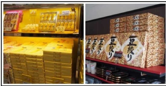
ภาพที่ 2 สินค้าที่ได้รับการห่อพร้อมเป็นของขวัญ ณ.จุดจำหน่ายของฝากประเทศญี่ปุ่น ที่มา : บันทึกภาพโดยสุพิศ เสี่ยงก้อน, 2553

ด้วยแนวคิดและวิธีการเหล่านี้ได้ถ่ายทอดสู่งานออกแบบบรรจุภัณฑ์ โดยเฉพาะสินค้าของฝากที่เราพบเห็นจนชินตาในจุดจำหน่ายต่าง ๆ ตามแหล่งท่องเที่ยวในประเทศญี่ปุ่น จะมีการห่อภายนอกเหมือนสิ่งนั้นเป็นของขวัญถึงแม้ภายในจะบรรจุอยู่ในกล่องป้องกันความเสียหายแล้วก็ตาม นั่นเพราะคนญี่ปุ่นใส่ใจในการให้กับการรับเป็นสำคัญ