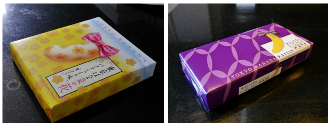
ภาพที่ 8 (ซ้าย-ขวา)ขนมโตเกียวบานาน่า ของดีประจำเมืองโตเกียว หลากรสชาติและบรรจุภัณฑ์