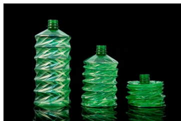
ภาพที่ 6 ขวดภาชนะบรรจุอัจฉริยะ ที่มีแนวคิดจากการพับแบบ “โอริกามิ”

นอกจากนั้นแล้วความแข็งแรงทางโครงสร้างในการพับแบบโอริกามิก็น่าจะตอบโจทย์ผู้ใช้สอยสำหรับบรรจุภัณฑ์ที่คุ้มครองป้องกันผลิตภัณฑ์และอำนวยความสะดวกในการใช้งานได้ดี ในโครงการวิจัยของนักศึกษาที่ทำร่วมกับโครเนส (Krones) ในการสร้างขวดภาชนะบรรจุอัจฉริยะที่สามารถบีบได้แบบหมดจด โดยมีแนวคิดมาจากการพับแบบโอริกามิ ที่ทำให้ขวดสามารถใช้บรรจุของเหลวชั้นหนืดได้ดี และสามารถบีบแบนให้ของเหลวภายในไหลออกจนหมดสุดทำได้อย่างสมบูรณ์แบบ (ศิรินทรา บุญสำเร็จ, 2017 : 72-73) เป็นการต่อยอดในการสร้างนวัตกรรมงานออกแบบบรรจุภัณฑ์ที่มีพื้นฐานจากวัฒนธรรมเก่าแก่ของญี่ปุ่น