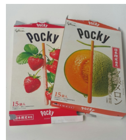
ภาพที่ 11 ภาพกล่องขนมที่มีรอยปรุทั้งสองด้าน สะดวกในการแกะและพับทิ้ง

ประเทศญี่ปุ่นเป็นผู้นำในการออกแบบบรรจุภัณฑ์ที่ใช้งานง่ายไม่ยุ่งยาก มีความเท่าเทียมในการใช้งานกับทุกคนที่เรียกว่า Universal Design Packaging ที่ช่วยส่งเสริมเกื้อหนุนให้เกิดบรรจุภัณฑ์รักษ์โลกไปพร้อม ๆ กัน ในหลากหลายวิธีการ ตัวอย่างเช่น กล่องขนมกุลิโกะ ป๊อกกี้ที่ออกแบบกล่องให้มีรอยปรุทั้งสองด้าน สามารถเปิดกล่องได้ง่ายและแกะพับให้แบนเพื่อทิ้งได้ง่ายขึ้น เอื้อต่อการรีไซเคิลและทิ้งขยะ ตามหลักการพื้นฐานของ Universal Design Packaging ในเรื่อง easy to dispose หรือการง่ายต่อการกำจัดทิ้งหลังการใช้งาน ช่วยลดต้นทุนและระยะเวลาในการกำจัดขยะ