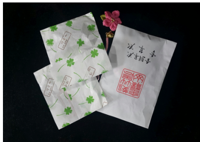
ภาพที่ 16 สินค้าของที่ระลึกชิ้นเล็ก ๆ กับบรรจุภัณฑ์ที่สวยงามสะอาดตา น่าจับต้อง

จากการสังเกต และการตั้งสมมุติฐานดังกล่าวข้างต้นเกี่ยวกับที่มาอันโดดเด่นสวยงามของบรรจุภัณฑ์ญี่ปุ่น ได้ข้อสรุป 5 แนวทาง พร้อมตัวอย่างงานออกแบบที่สนับสนุนแนวความคิดนี้ดังตาราง