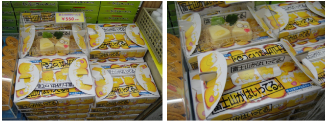
ภาพที่ 12 สินค้าของฝากที่สวยงาม หิ้วได้ง่าย พับวางซ้อนได้สะดวก

สินค้าแล้ว ยังคำนึงถึงผู้ซื้อที่เป็นนักท่องเที่ยวจะสามารถหิ้วกลับและซื้อไปได้จำนวนมาก ๆ เพราะสามารถพับหิ้ววางซ้อนได้ง่าย สะดวกในการขนส่ง