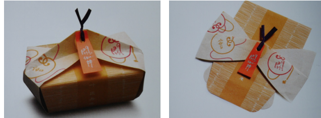
ภาพที่ 3 (ซ้าย-ขวา)บรรจุภัณฑ์ขนมญี่ปุ่น ซึ่งมีที่มาจากรูปแบบการห่อแบบฟูโรชิกิ