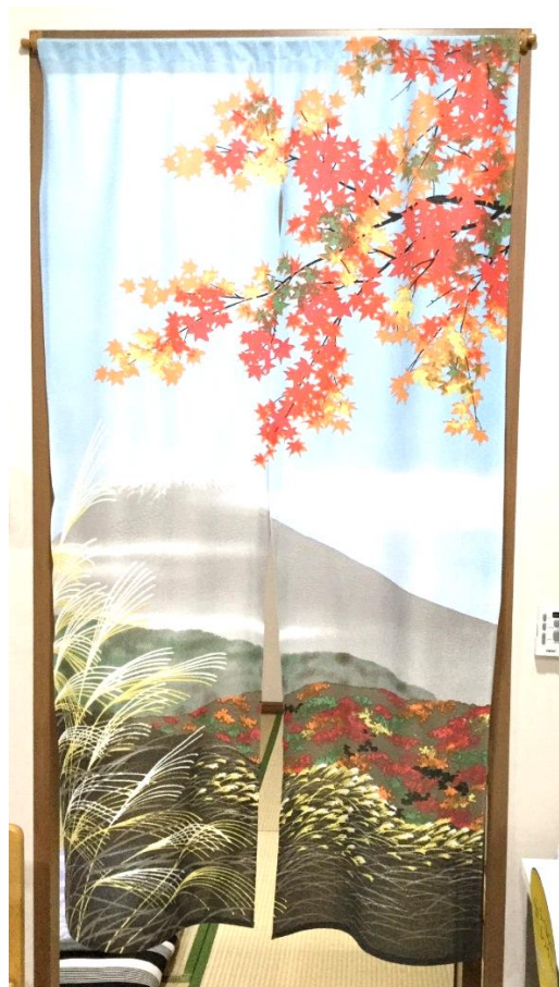
ตัวอย่างการออกแบบและตกแต่งห้องของชาวญี่ปุ่นที่พำนักระยะยาว ในอำเภอศรีราชา จังหวัดชลบุรี

● อาหารที่มีรสชาติของอาหารญี่ปุ่น เนื่องจากอาหารถือเป็นรากฐานของวัฒนธรรม เมื่ออยู่ต่างประเทศอาหารจึงเป็นส่วนหนึ่งของความพยายามรักษาวิถีชีวิตที่เคยปฏิบัติ และรักษาตัวตนของตัวเองไว้ได้ ชาวญี่ปุ่นที่มาพำนักในศรีราชาจึงต้องการอาหารญี่ปุ่นที่ปรุงให้มีรสชาติให้มากที่สุด และต้องการเครื่องเคียง เครื่องต้ม ตามที่ชาวญี่ปุ่นนิยม เช่น บ๊วยดอง เหล้า บ๊วย เพื่อให้ยังคงระลึกถึงความเป็นญี่ปุ่นของตนเอง