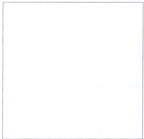
ภาพประกอบ 1 แบบสื่อกระดานกราฟแม่เหล็ก (ด้านหน้า)