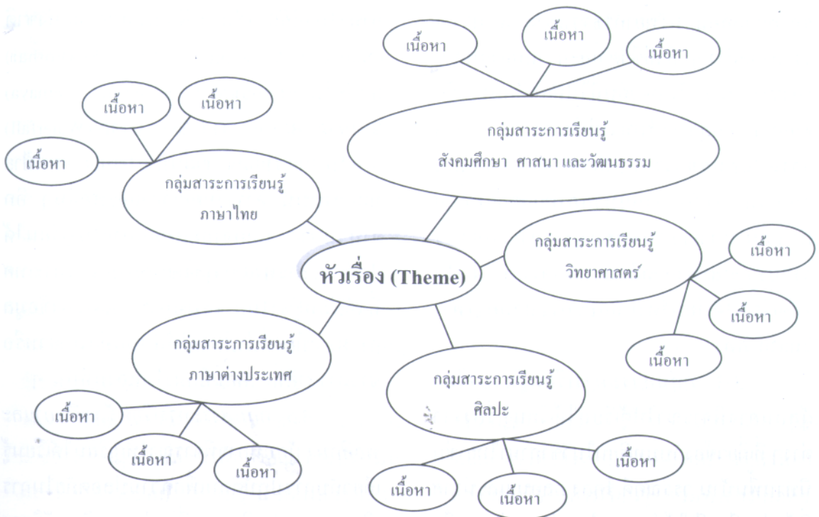
ภาพที่ 1 แผนผังความคิดการบูรณาการความรู้ในสาขาวิชาต่าง ๆ

การจัดทัศนศึกษาในรูปแบบของการบูรณาการนั้น ผู้สอนสามารถกำหนดรูปแบบการเรียนการสอนและพิจารณาคัดเลือกเนื้อหาสาระของแต่ละสาขาวิชาได้ตามความเหมาะสมดังตัวอย่าง เช่น