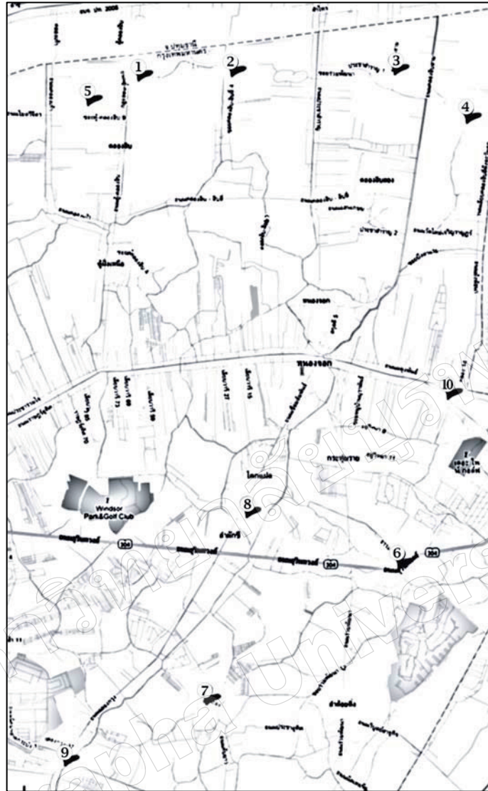
ภาพที่ 1 แสดงพื้นที่ที่ศึกษา (1) คลองสิบเอ็ด, (2) คลองสิบสอง, (3) คลองสิบสาม (4) คลองสิบสี่ (5) คลองสิบ (6) คลองสอง (7) คลองกระทุ่มล้ม (8) คลองลำแขก (9) คลองลำปลาทิว และ (10) คลองแสนแสบ (ดัดแปลงจาก https://maps.google.co.th/maps?q=%E0....bav=on.2,or.r_cp_r_qf.&bvm=bv.45512109,d.bmk&biw=1213&bih=604&wrapid=tlif136644250858810&um=1&ie=UTF-8&hl=th&sa=N&tab=wl )

15 วงศ์ 20 สกุล 27 ชนิด และ 6 ชนิดย่อย แบ่งออกเป็นหอยฝาเดียว จำนวน 11 วงศ์ 12 สกุล 13 ชนิดและ 2 ชนิดย่อย หอยกาบน้ำจืด จำนวน 4 วงศ์ 8 สกุล 14 ชนิด และ 4 ชนิดย่อย ค่าปัจจัยทางกายภาพ พิกัดทางภูมิศาสตร์ แสดงดังตารางที่ 1 และชนิด การแพร่กระจาย และถิ่นอาศัยแสดงดัง ตารางที่ 2 และภาพที่ 2 ตามลำดับ