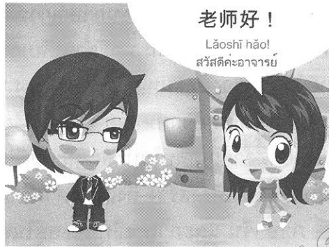
บทเรียนออนไลน์ภาษาจีน