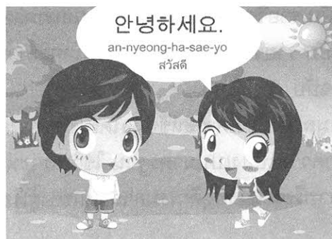
บทเรียนออนไลน์ภาษาเกาหลี

๑. ผลการสำรวจความพึงพอใจของนิสิตที่มีต่อการเรียนบทเรียนออนไลน์ภาษาเกาหลี ภาษาจีน และภาษาญี่ปุ่น พบว่า นิสิตมีความพึงพอใจบทเรียนออนไลน์ในระดับมาก ในส่วนแฟลชแอนิเมชันนั้น นิสิตพอใจในรูปแบบสีสันสวยงาม และรู้สึกที่น่าสนใจมากที่สุด เนื่องจากในส่วนนี้เป็นการสื่อเนื้อหาของบทเรียนด้วยการจำลองภาพเคลื่อนไหว จำลองสถานการณ์เป็นฉาก ๆ ผ่านภาพการ์ตูนในลักษณะของการสนทนา ผู้เรียนได้เห็นภาพ ได้ยินเสียงภาษาเกาหลี ภาษาจีน ภาษาญี่ปุ่น และยังมีตัวอักษรเกาหลี จีน ญี่ปุ่น พร้อมคำอ่าน และคำแปลประกอบ การที่แฟลชแอนิเมชันมีรูปแบบสีสันสวยงาม น่าสนใจ คุณภาพเสียงประกอบบทเรียนชัดเจน ขนาดตัวอักษรเหมาะสม รูปแบบการใช้งานง่าย ไม่ซับซ้อน ช่วยให้ผู้เรียนเข้าใจในเนื้อหาบทเรียนมากยิ่งขึ้น ดังตัวอย่าง