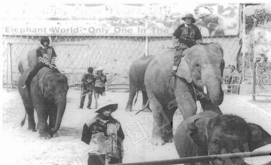
ภาพที่ 63 ความซึ้งหมิงของชุมชนบ้านตากกลาง

2.2 ในครอบครัวมีช้างหลายเชือก ชาคคนช่วยเลี้ยง หัวหน้าครอบครัวเองก็อายุมากขึ้น จึงต้องให้บุตรสาวมาช่วยแบ่งเบาภาระครอบครัว