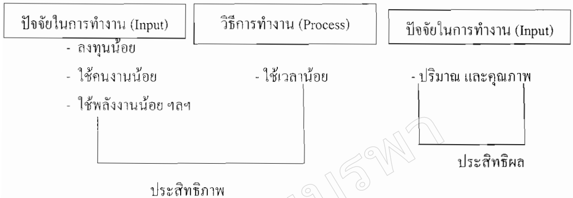
ภาพที่ 2 การบริหารเชิงระบบที่มีประสิทธิภาพและประสิทธิผล (บุรุษย์ ศรีมหาสาร, 2542)

ระหว่างประสิทธิภาพกับประสิทธิผลนี้ ทฤษฎีการบริหารเน้นให้พิจารณาประสิทธิผลก่อน คือ ทำได้ตามที่คาดหมาย ก่อนจะพิจารณาประสิทธิภาพ บางครั้งเราอาจทำงานมีประสิทธิภาพมาก แต่ไม่ได้ผลตามที่คาดหมาย เช่น ต้องการผลิตนักเรียนให้เป็นพลเมืองดี แต่เราอาจทำไม่ได้ แต่ผลิตได้จำนวนมาก ซึ่งไม่สมกับเป้าหมายการศึกษา (วิชัย ต้นศิริ, 2549, หน้า 308)