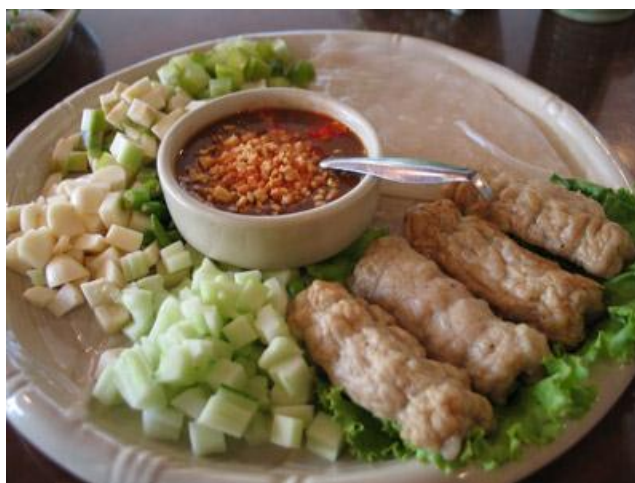
ภาพ 7.1 แสดงอาหารพื้นบ้านของชาวเวียดนาม

ภาพ 7.1. แสดงอาหารพื้นบ้านของชาวเวียดนาม ซึ่งประชาชนในภาคตะวันออกเฉียงเหนือของประเทศไทยนิยมรับประทาน ซึ่งมีขายอยู่จำนวนมากในพื้นที่จังหวัดภาคตะวันออกเฉียงเหนือ ประกอบไปด้วย ผักและผลไม้ประเภทต่างๆเป็นหลัก เช่น แตงกวา มะม่วง พริกชี้หนู มะเฟือง กล้วยดิบ กระเทียม ผักกาด และมีเนื้อสัตว์ประกอบให้ ในการรับประทานอาหารเวียดนามนั้น จะใช้แผ่นแป้งบางๆที่ทำขึ้นเป็นพิเศษเพื่อใช้ห่อหุ้มผักและผลไม้ที่หั่นเป็นชิ้นเล็กๆพร้อมด้วยน้ำจิ้มเพิ่มรสชาติอาหาร กำลังเป็นที่นิยมของประชาชนในภาคตะวันออกเฉียงเหนือ