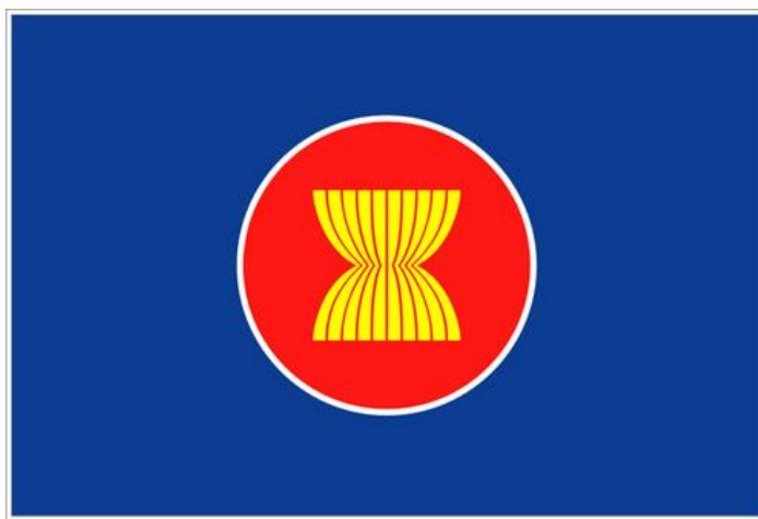
ภาพ 4.2 แสดงธงชาติอาเซียน

การลงนามปฏิญญาอาเซียนมีเป้าหมายและจุดประสงค์หลักใหญ่ คือ 1. เร่งรัดการเจริญเติบโตทางเศรษฐกิจ ความก้าวหน้าทางสังคมและการพัฒนาวัฒนธรรมในภูมิภาค 2. ส่งเสริมด้านสันติภาพและเสถียรภาพในภูมิภาค โดยการเคารพหลักความยุติธรรมและหลักนิติธรรมในการดำเนินความสัมพันธ์ระหว่างประเทศในภูมิภาค ตลอดจนยึดมั่นในหลักการแห่งกฎบัตรสหประชาชาติ