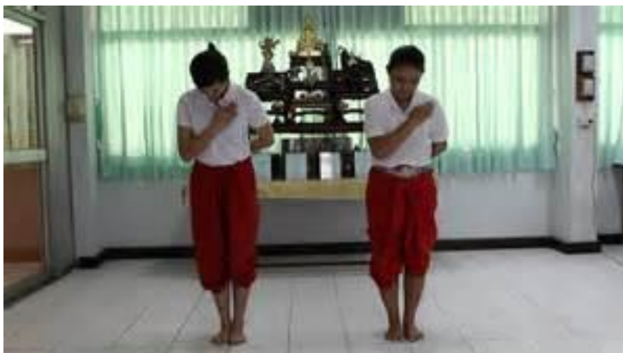
ภาพ 7.10 แสดงการทักทายของชาวอินโดนีเซีย

จากภาพ 7.10 แสดงวัฒนธรรมการทักทายของชาวอินโดนีเซีย จะเห็นได้ว่าชาวอินโดนีเซียมักจะทักทายกันโดยกล่าวคำว่า “เซลามัทปากิ” โดยมีท่าทางประกอบคือ ใช้มือขวาแนบที่หน้าอก แล้วใช้มือซ้ายไพล่หลัง ก้มตัวลงเล็กน้อย