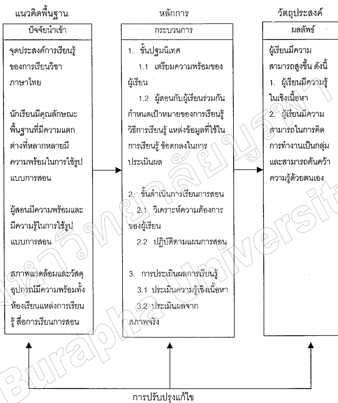
ภาพที่ 3 รูปแบบการสอนที่เน้นผู้เรียนเป็นสำคัญในวิชาภาษาไทยสำหรับนักเรียนชั้นมัธยมศึกษาปีที่ 1