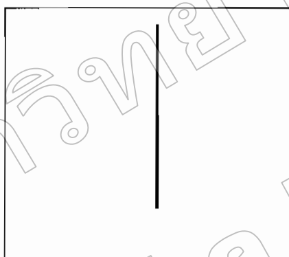
เส้นมาตรฐาน

และแนวคิดของ แอช (Asch, 1965 อ้างถึงใน สุพรรณิกา ทิพพศรี, 2547, หน้า 28-29) ได้ทำการศึกษาพฤติกรรมการคล้อยตามทางสังคมที่ได้รับการกล่าวถึง โดยเขาทดลองการรับรู้ทางสายตา ผู้รับการทดลองหลายกลุ่ม มีขนาด ตั้งแต่ 7, 8 และ 9 คน ถูกจัดให้นั่งรอบๆ โต๊ะ ผู้ทดลองเสนอภาพดังรูปข้างล่างนี้ให้ผู้รับการทดลองดู แล้วขอให้ผู้รับการทดลองตอบต่างๆ ทีละคน ตามลำดับ ว่าเส้นที่อยู่ในรูปข้างล่างซ้ายมีอนาจจะจับคู่ ได้กับเส้นใดใน 3 เส้น ในรูปทางขวามือ