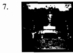
Wat Khao Sukim