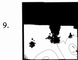
Khung Kraben Bay