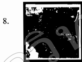
Pliw Waterfall National Park