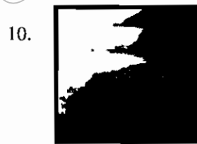
Khung Wiman Beach