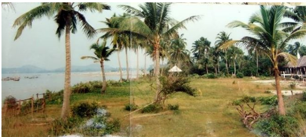
ภาพถ่ายเก่า แนวต้นมะพร้าว พ.ศ. 2535

การจัดการแก้ไขปัญหา ก็ได้มีการนำเสนอข้อเท็จจริงผ่านสื่อสาธารณะและอินเทอร์เน็ต เข้าร่วมการประชุมเสวนาการแก้ไขปัญหา และการติดตามผลการฟ้องร้องคดีที่อยู่ระหว่างการพิจารณาของศาลปกครองสูงสุด โดยยังไม่สามารถเรียกร้องค่าเสียหายจากหน่วยงานของทางราชการได้